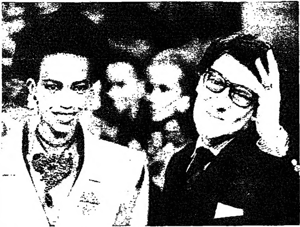
المصمم الفرنسى المعروف ايف سان لوران يحيى الحضور عقب الانتهاء من عرض مجموعته من الازياء الاولى . وتكف الى جانبه واحدة من عارضاته . - ر